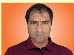
Diretor: André Moisés da Silva MRV Engenharia e Participações S/A