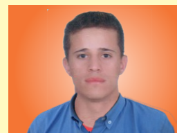
Diretor: Tayrone de Brito Silva Manoel Gomes Figueiredo